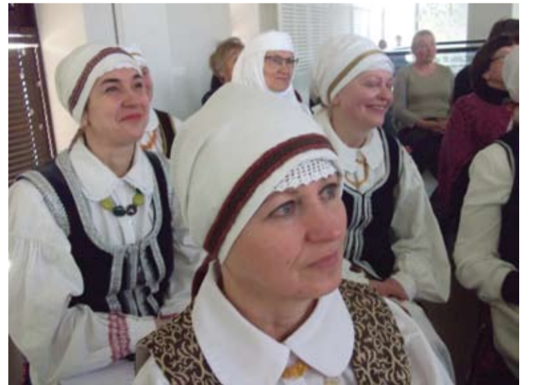
Linksmos ir gerą nuotaiką skleidžiančios „Valaukio“ moterys...

Antrojeje, pokalbių ir šnabždesių dalyje, prie kavos puodelio smagiai kabėtasi apie kraštotyra, istoriją, knygas, patyrimus, ieškojimus, apie karą Ukrainoje ir vėluojantį, bet jau jau per slenkstį žengiantį tikrą pavasarį.