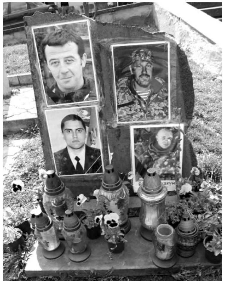
Paminklinė lenta keturiems Bžezanų gyventojams, žuvusiems kovoje su Rusijos okupantais 2014-2022 metais.